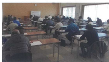
1級・2級の問題を解く受験者

参加企業 (五十音順) コマニー株式会社 JA 能美 株式会社タガミ・イーエクス 株式会社東振精機 はくさん信用金庫 北陸電力株式会社小松支店